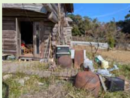
令和7年12月30日 里山森守活動隊_新富

新富は、畑に竹の侵入もなくスッキリしているので気持ち良くクヌギの養生が出来た。太ってきている。