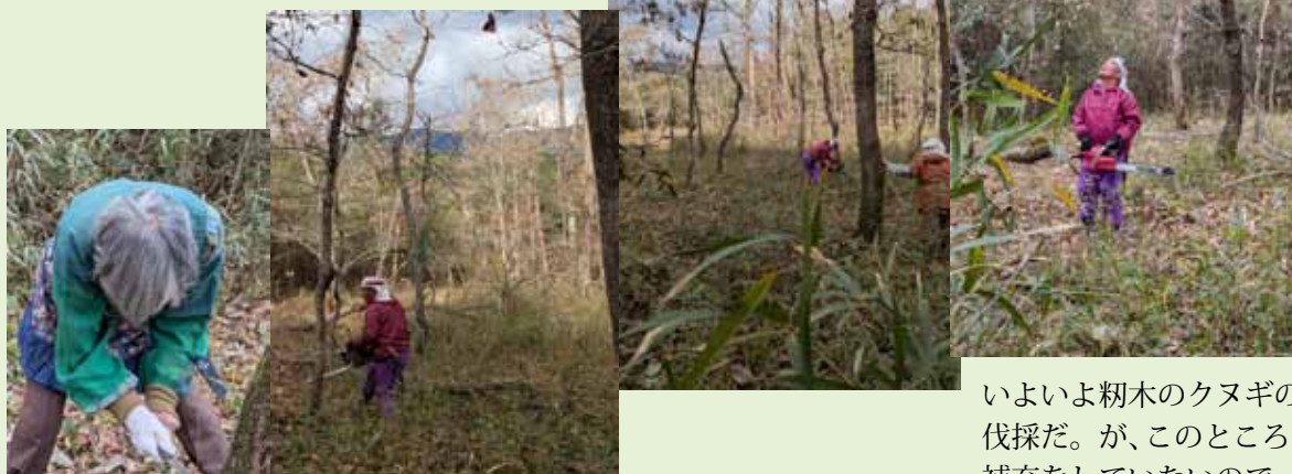
令和7年12月14日 里山森守活動隊_靱木 伐採

いよいよ靱木のクヌギの伐採だ。が、このところ、補充をしていないので、クヌギが少しスカスカしてきたような気がする。今年には少なめに切ることにした。少し養生して太るのを待つのも必要な気がする。